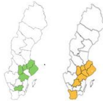
Län som ingår i LIIINILS gräsmarker (grönt) och LIIINILS småbiotoper (gult), år 2009-2014

Både småbiotops- och gräsmarksuppföljningen är så kallade gemensamma delprogram inom den regionala miljöövervakningen. Arbetet i programmen gör vi samordnat med NILS stickprov och organisation för flygbildstolkning och fältarbete.